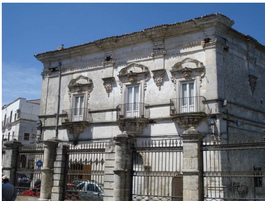
Monte Sant'Angelo: Palazzo dei Grimaldi (sec. XVII)

Tutto questo Giosofatto Pangallo lo mette ben in evidenza, quasi come se lui stesso fosse partecipe alla ricostruzione