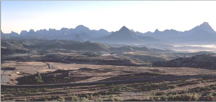
Le montagne di Adua

rale Oreste Baratieri, e l'esercito abissino di Menelik II 21 . Nel fatto d'armi, che pose termine alle operazioni militari della campagna d'Africa Orientale, perirono in poche ore ben 7000 italiani, 1500 rimasero feriti e 3000 furono i prigionieri.